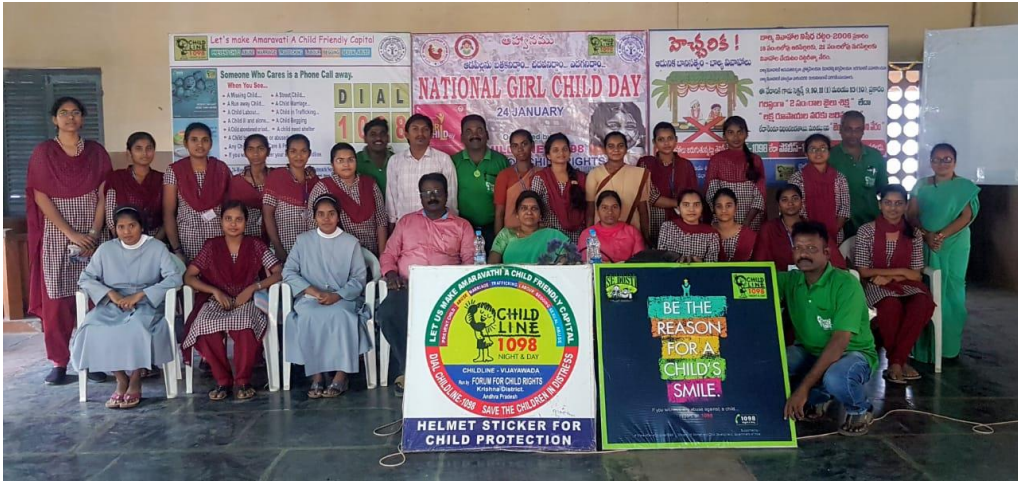
Week long National Girl Child Day – Celebration